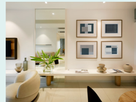
Không gian căn hộ với phong cách thiết kế hiện đại.

Gắn liền với NĂM giá trị cốt lõi: GIA ĐÌNH, LẮNG GIẾNG, CỘNG ĐỒNG, SỰ KẾT NỐI và SỰ TIỆN NGHI, Desa ParkCity được mệnh danh là "khu đô thị kiểu mẫu" đáng sống nhất và được săn đón nhất ở Kuala Lumpur.